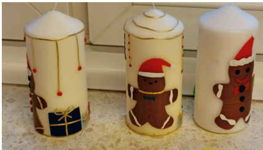
Familien basteln ihre Adventskerze

Der Arbeitskreis Kinder und Familie entstand nach der Synodalversammlung und hat sich zur Aufgabe gemacht, Angebote zu entwickeln, die Familien ansprechen. Der AK kooperiert eng mit dem Familienzentrum Hochwald. Wenn Sie Zeit und Lust haben, freuen wir uns über Ihre Mitarbeit im Arbeitskreis. Sprechen Sie uns gerne an. Für den AK, Tanja Buchheit-Thewes