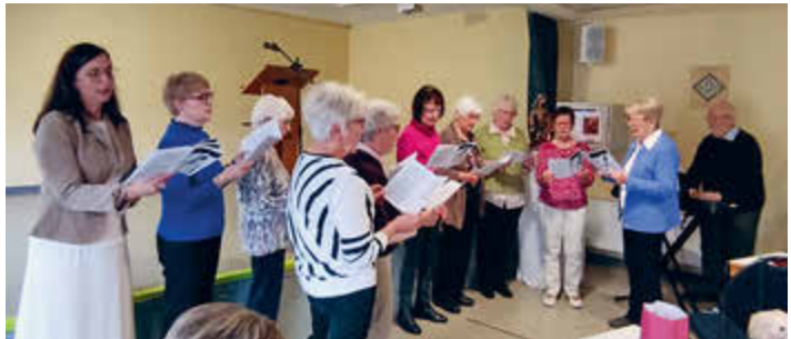
Der Frauenchor umrahmt den Nachmittag

Im Anschluss an den Kassenbericht trug der Vorstand einen besinnlichen Text über „Maria Knotenlöserin“ vor – ein geistlicher Impuls, der daran erinnerte, die eigenen Sorgen vertrauensvoll in Gottes Hände zu legen.